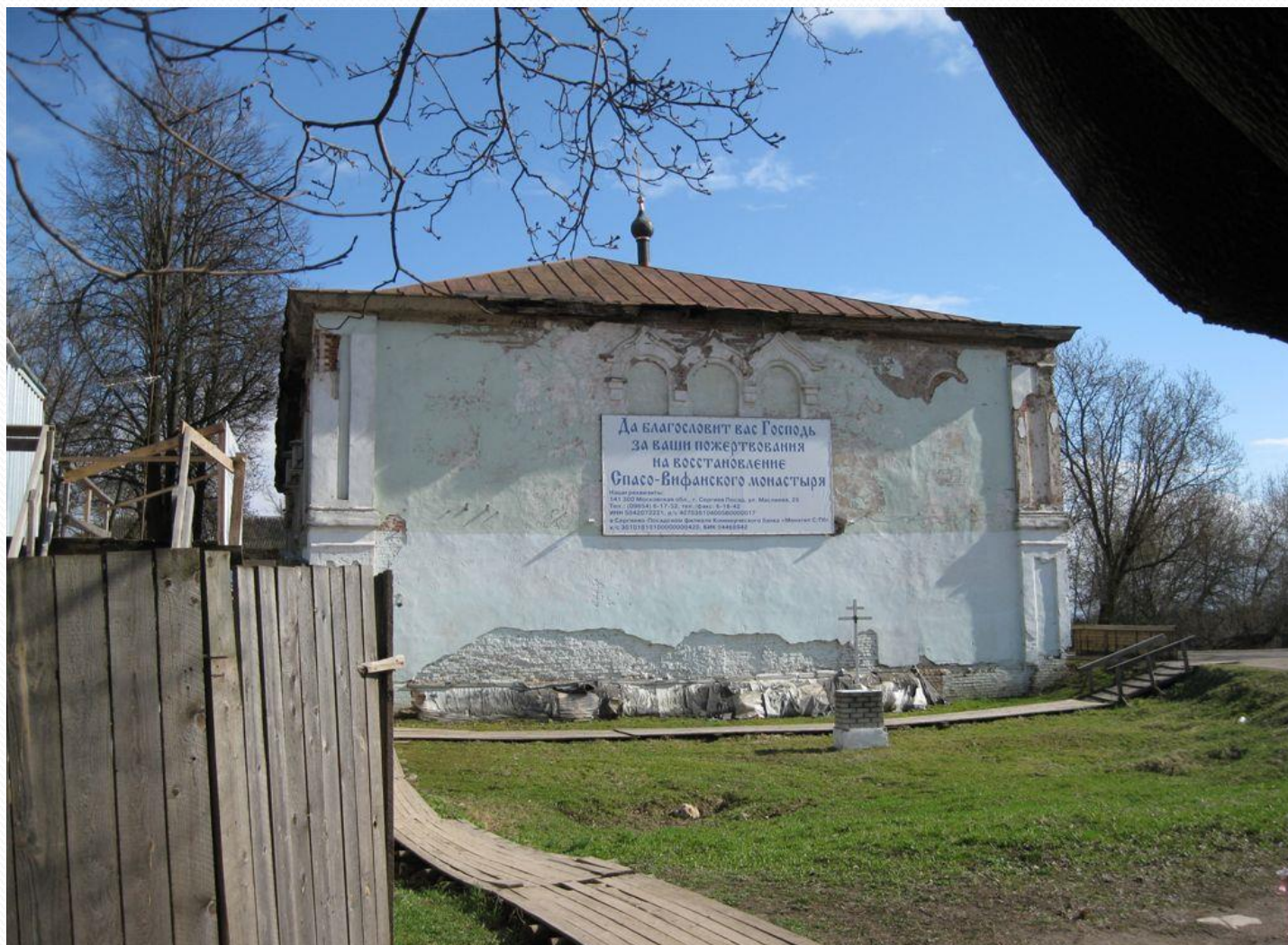
Храм Сошествия Святого Духа с приделом в честь Николая Чудотворца